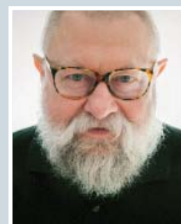
Prof. dr hab. Jerzy Bralczyk Przewodniczący Rady Programowej Europejskiego Forum Prawa i Edukacji

Miejsce: Warszawa, Pałac Staszica, ul. Nowy Świat 72.